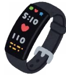
スマートウォッチ