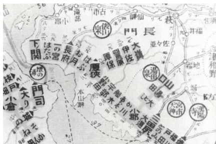
大正2年の鉄道図の一部

大正5年、美禰軽便鉄道(伊佐・重安間)が営業を開始。その後、鉄道院は大正9年にこれを買収して国有鉄道とし、厚狭・重安間を「美祢線」と称した。翌10年には美祢線重安・於福間が開通して、迂回線は幻のものとなった。