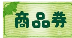
カルストさくらギフト券 (5,000円分または3,000円分)