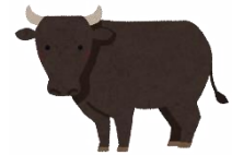
秋吉台高原牛 (3,000円分)