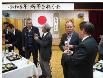
令和6年 新年を祝う会