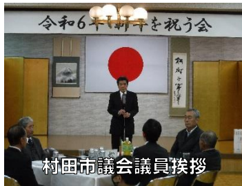
村田市議会議員挨拶