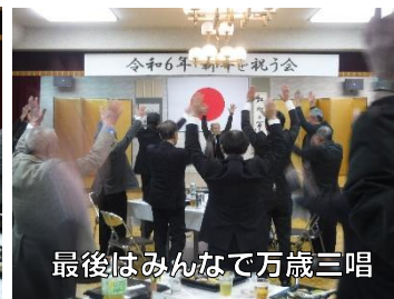
最後はみんなで万歳三唱

1月20日(土)、4年ぶりに新年を祝う会を開催。これまで、1月1日に開催していましたが、より多くの方が気軽に参加できるよう、開催日を1月第3土曜日に変更。今年41名が参加されました。