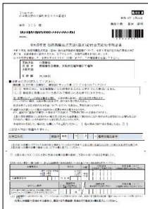
送付された封筒および手続書類