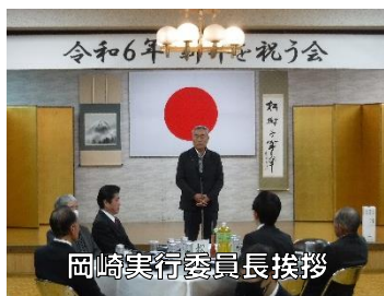
岡崎実行委員長挨拶