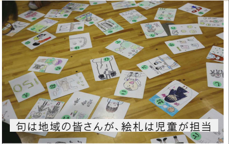
句は地域の皆さんが、絵札は児童が担当