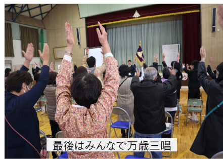
最後はみんなで万歳三唱