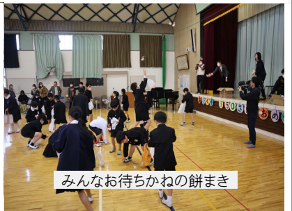
みんなお待ちかねの餅まき