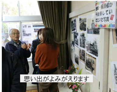
思い出がよみがえります