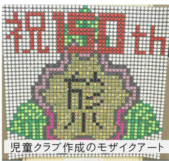
児童クラブ作成のモザイクアート

企画から当日の進行まで、児童が中心となって行われました。当日は学校関係者や保護者のほか、多くの地域の皆さんも参加。みんなで於福小の150歳をお祝いしました。参加者からは「小学生時代を思い出した」、「これまで知らなかった於福小の歴史を知れた」等の感想があがっていました。