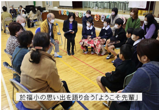
於福小の思い出を語り合う「ようこそ先輩」