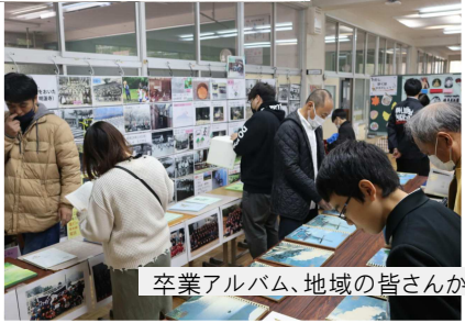
卒業アルバム、地域の皆さんから寄せられた写真、児童の作品を展示