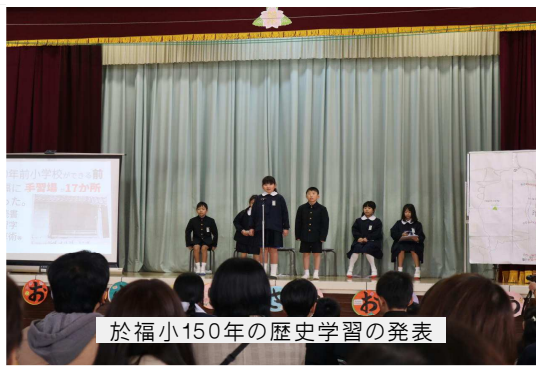
於福小150年の歴史学習の発表