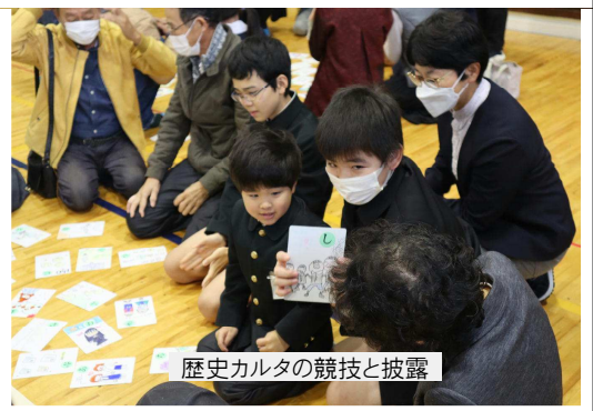
歴史カルタの競技と披露