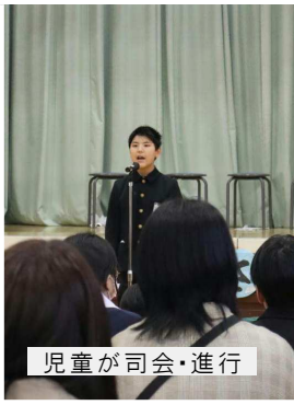
児童が司会・進行