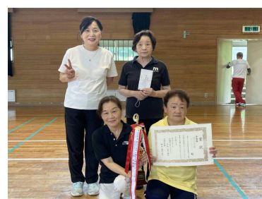
準優勝:ラブリーおばちゃんズ(駅前)