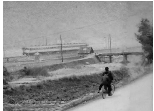
現在の於福多目的広場(旧第2グラウンド)付近を走行する急行さんべ(昭和40年代)

で走った(上りは逆の編成)。その後、鳥取延長や編成増強が行われたが、1975(昭和50)年に小郡行き編成を廃止、1985(昭和60)年には下関までの山陰本線経由1往復のみとなる。その間、夜行も1984(昭和59)年に廃止され、最終的に昼行も1997(平成9)年に廃止された。