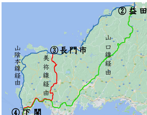
山口県付近での運行形態