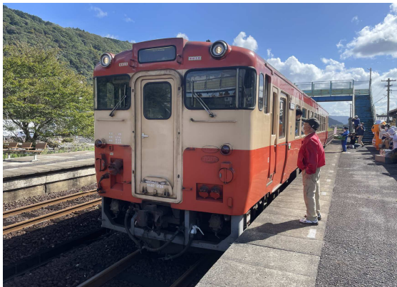
昨年運行された国鉄急行色の特別列車「ノスタルジー号」

「やくも」は1965(昭和40)年に「やえがき」と改称のうえ種別も急行となる、さらに1968(昭和43)年には「さんべ」に改称された。この時設定されたのは、キハ58系気動車による昼行2往復と客車による夜行1往復。昼行のうち1往復はユニークな運行形態で知られた。下りは米子を7両で出発し、益田で2両の山口線経由小郡(現・新山口)行き編成を切り離した後、長門市で山陰本線経由の3両と美祢線経由の2両に分割(美祢線内の停車駅は長門湯本と美祢)、これらは下関で再度連結し、熊本まで走った(上りは逆の編成)。その後、鳥取延長や編成増強が行われたが、1975(昭和50)年に小郡行き編成を廃止、1985(昭和60)年には下関までの山陰本線経由1往復のみとなる。その間、夜行も1984(昭和59)年に廃止され、最終的に昼行も1997(平成9)年に廃止された。