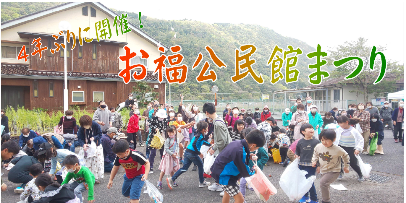
もちまきでは大人も子どももみんな必死