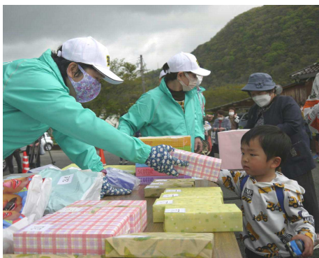
何が当たったかな？ビンゴ大会