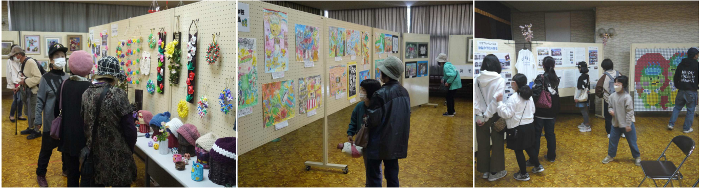
思わず見入るもの、元気がでるもの、癒されるもの たくさんの作品が一堂に会した作品展