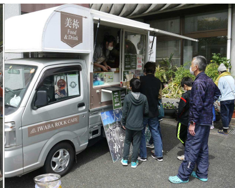
大人気だったキッチンカーとバザーコーナー