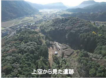
上空から見た遺跡

令和3年7月から11月にかけて行われた於福金山遺跡の発掘調査で出土した遺物が現在、山口県埋蔵文化財センター（山口市春日町3-22）に展示されています。