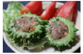
↑私(主事)は普通のゴーヤで作ってみました。