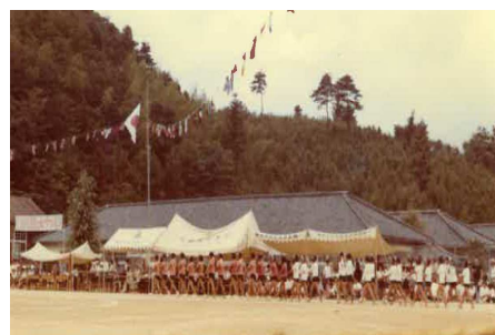
旧校舎時代の運動会 入場行進のようす