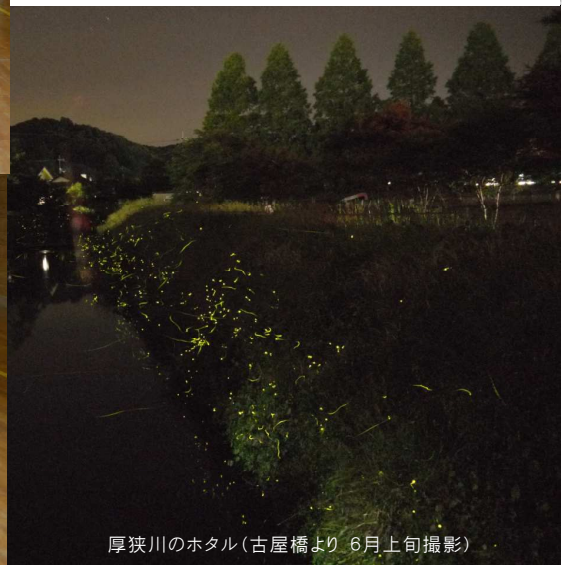
厚狭川のホテル(古屋橋より 6月上旬撮影)