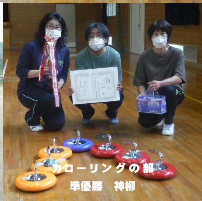
カローリングの部 準優勝 神柳