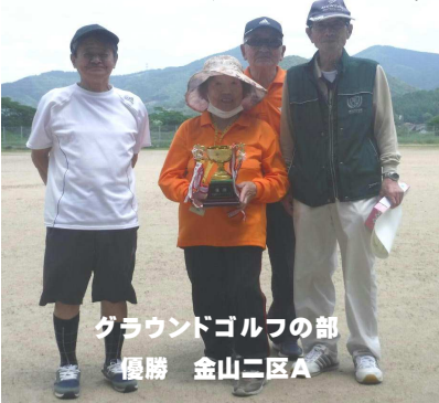
グラウンドゴルフの部 優勝 金山二区A