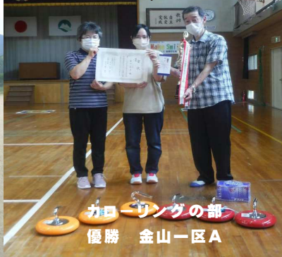
カローリングの部 優勝 金山一区A