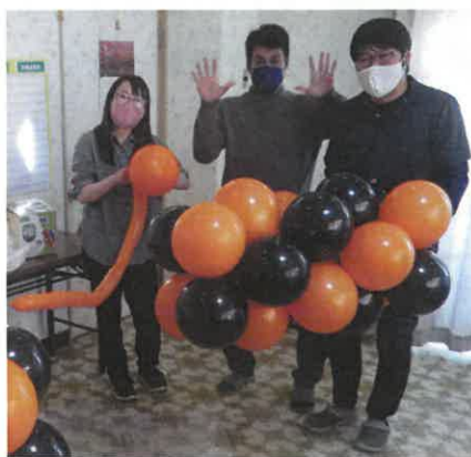
美祿魅力発掘隊の3人がバルーンアートを作ってくれました