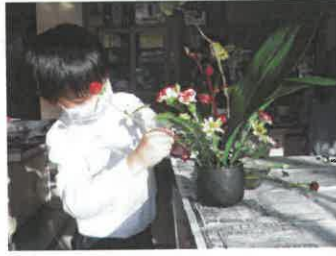
バランスを考えながら生けていきます。