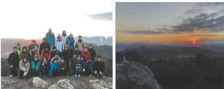
昨年度は残雪のため中止となりましたが、令和2年(令和元年度)は綺麗な日の出を拝めました。