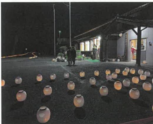
於福駅周辺では300基もの提灯が点灯。