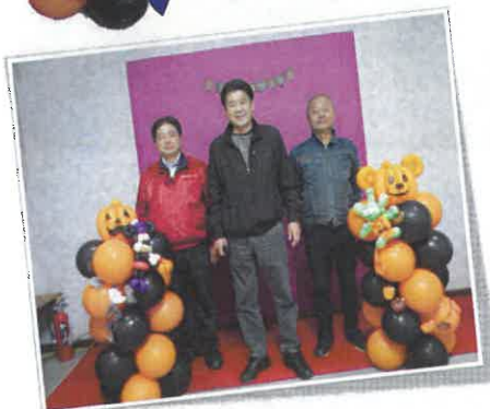
インスタントカメラで撮った写真をプレゼント。