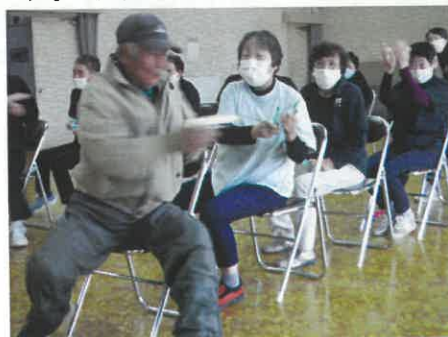
チーム対抗ゲームに挑戦！