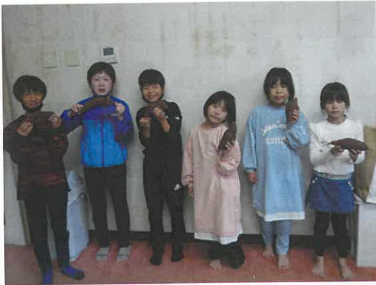
いちばん大きな芋を見せてくれました。

10月25日（月）、児童クラブで秋芳町にある八代ぬくもりの里に芋ほり体験に行きました。土が柔らかく、掘りやすかったそうです。袋いっぱいの芋を抱え、とても嬉しそうでした。