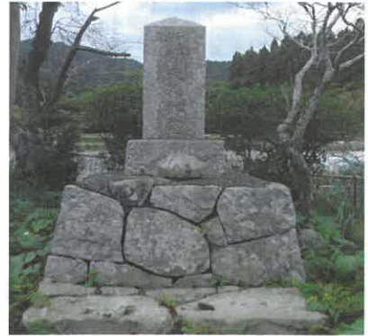
丸尾公園にある於福御前御霊