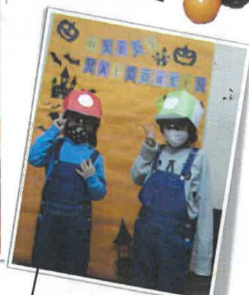
おふカップも作ってくれたよ!