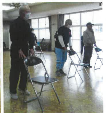
椅子を使ったストレッチ