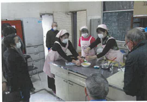
調理が進むにつれていい香りが漂ってきました。

11月15日（月）、食推の簡単3分クッキングが行われました。「肉巻おさつ」、「無限にんじんサラダ」、「レンジ半熟チーズ卵とじ」の作り方が紹介されました。男性の参加者も多く、「これまであまり台所に立つ機会が無かったが、簡単にできそうなので家に帰ったら作ってみよう」と話されていました。