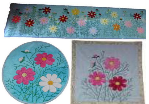
↑パッチワークあじさいによる コスモスモチーフのパッチワーク