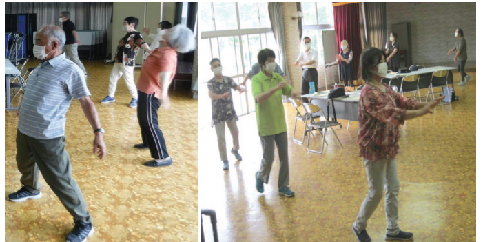
山口弁のラジオ体操