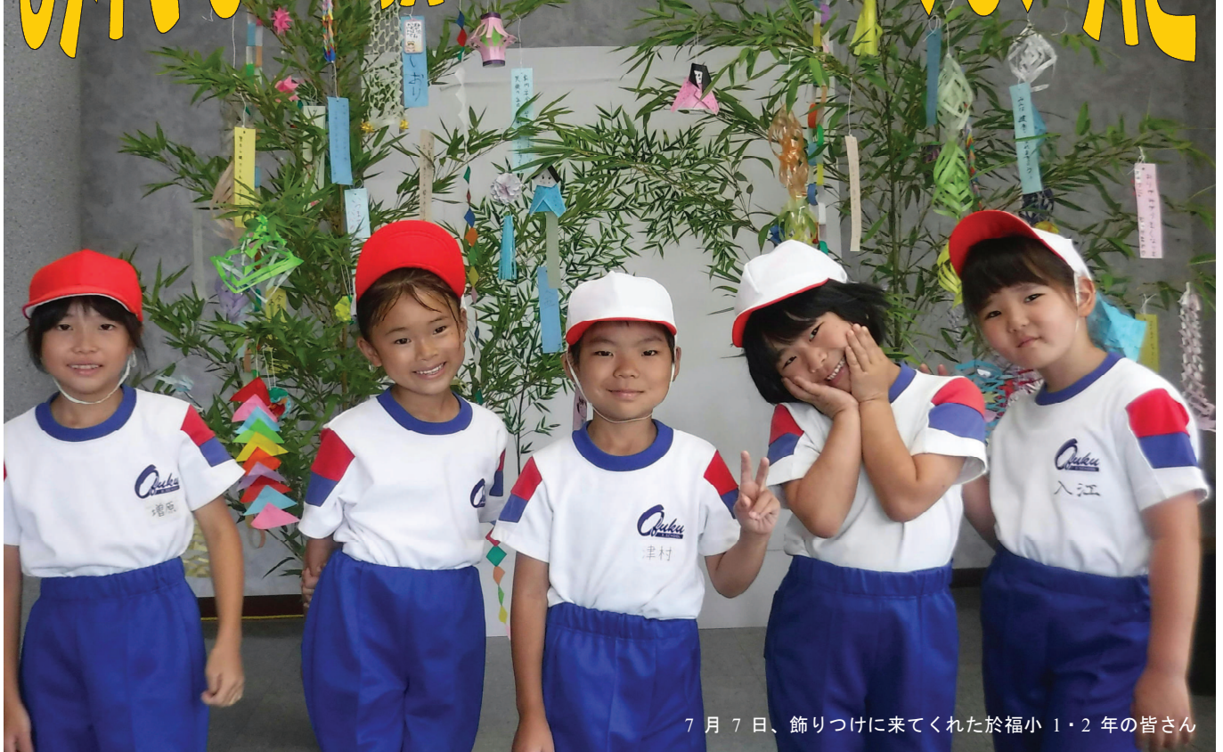
7月7日、飾りつけに来てくれた於福小1・2年の皆さん