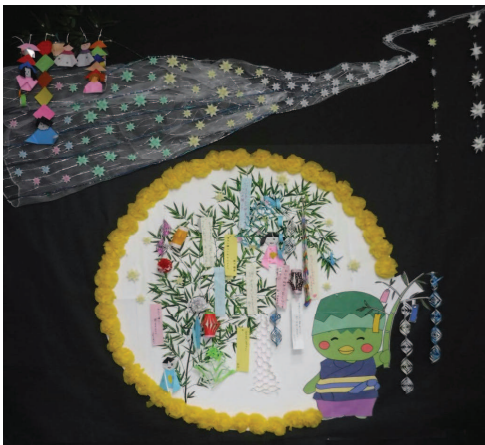
完成したタペストリー