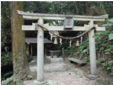
水 神 社

水神は、古来より西寺地区の祭神で、古い昔から「乳守りの神様」といわれています。祠のそばにある石灰岩の大岩から垂れている鍾乳石があたかも乳房のような形をしており、それからしたたる水滴を飲むと乳が出始め、また乳の量も増すと言われています。