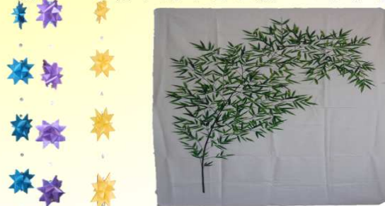
←これがタペストリーです。

お知らせ ★七夕（7月7日） に向けて公民館内 に笹竹とペストリーを設置します。ご来館 の際はぜひ飾り付けをお願いします♪