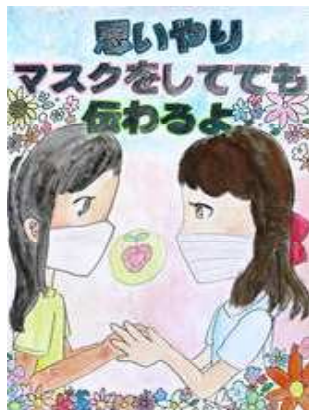
増原 仁香 (於福小6年)