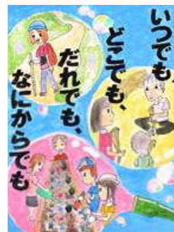
増原 仁香 (於福小6年)