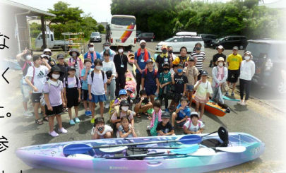
令和3年7月 シーカヤック体験

5月12日(木)、於福町子連総会が開催され、令和4年度の役員、予算等が決定しました。今年度もコロナ禍でも子ども達が楽しめるような行事を開催していくことを確認しました。行事開催の際は参加をお待ちしています。