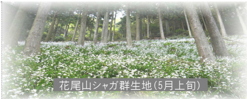
花尾山シャガ群生地(5月上旬)