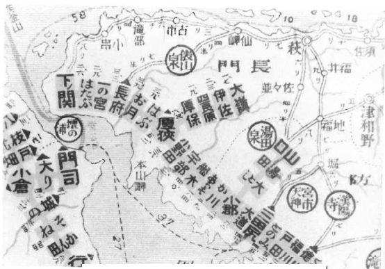
大正2年の鉄道図の一部

安間を「美祢線」と称した。翌10年には美祢線重安・於福間が開通して、迂回線は幻のものとなった。