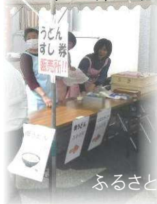
ふるさと祭り (H27年度~31年度の様子)