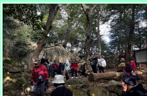
羅漢山の摩崖仏を見学