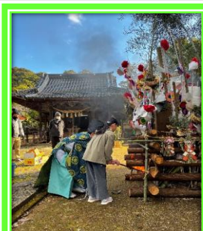
どんと焼きの火入れ