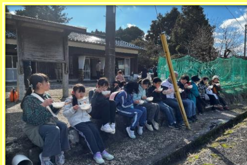
みんなでせんざいを食べて、まったり