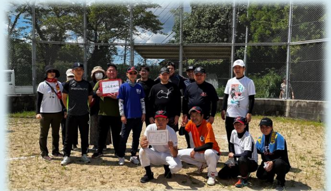
美祿社会復帰促進センターチーム