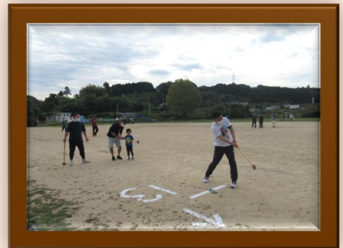
昨年度グラウンドゴルフ大会の様子

日時 令和5年9月24日(日) 8時30分 会場 豊田前小学校グラウンド 参加対象 豊田前町にゆかりのある小学生以上。 (お孫さんと一緒のチーム也大歓迎！) チーム編成 1チーム3名。 各地区ごとにチームを作ります。 申込方法 ゆう・あい振興会推進員へお申し出 ください。