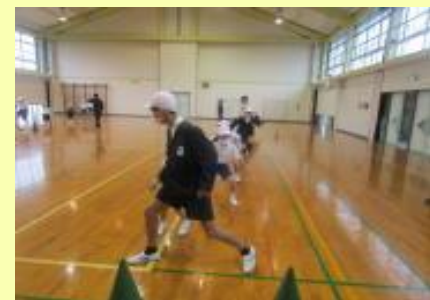
6年生のリードで反復横跳び練習