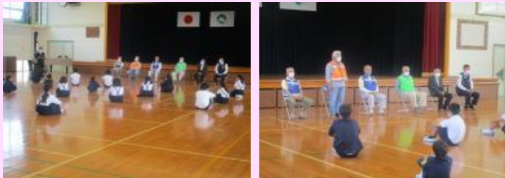
皆様、今年度もどうぞよろしくお願いいたします。