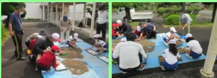
みんなで協力して取り組みました

4年生と美祿分教室の児童が粃まきをしました。地域の方のご指導の下、丁寧に作業をしました。今年度もみんなで米作りに取り組みます。