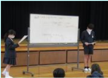
高学年による進行

1年生を迎える会について、1年生に楽しんでもらえる内容を、2年生以上のみんなで考えました。