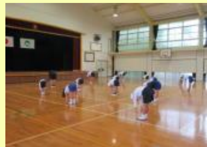
ジャックナイフストレッチ

中間時間に体力づくりに取り組んでいます。この日は準備運動の後、屋内で行う新体力テストの種目を実際にやってみました。