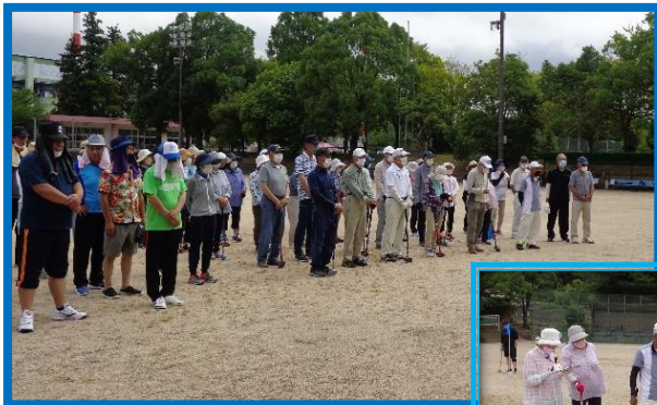
日頃の練習の成果が 出ましたね!!

7月3日(日)伊佐公園グラウンドにて、第25回伊佐町民グラウンドゴルフ大会が開催されました。当日の天候は少々不安でしたが、ラウンド中は降雨もなく行うことができました。11チーム(1チーム5人)もの参加がありました。ホールインワンも数回でて、大変盛り上がりました。10ホールを2周回った結果、西本町チームが優勝しました。おめでとうございます!