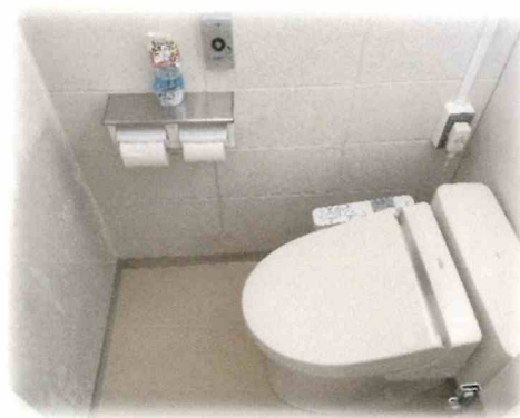
伊佐公民館 男子トイレ

この工事で、各トイレ1台ずつ洋式になりました。工事期間中は利用者の皆様には、ご不便をおかけし申し訳ございませんでした。