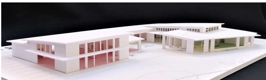
市民ワークショップでは、図面に加え、模型を用いて基本設計案について説明しました。写真は、県道31号側からの建物外観のイメージ。