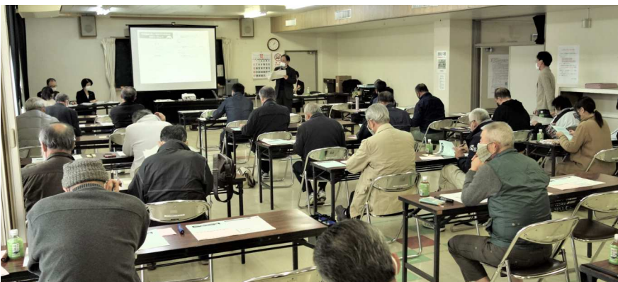
市民29名が集まり、新型コロナウイルス感染症の対策から、グループではなく教室型の机配置で、意見を出し合いました。

中庭を取り囲むようにつながる市民ロビーは、市民の居場所であり観光客が地域の情報を得る拠点としての役割を担い、ロビーの周りに図書館、総合支所、公民館諸室、多目的ホールとつながっています。この考え方は参加者から多くの支持を集め、基本設計のベースとすることにおおむねの合意が形成されました。今後もさらに検討を重ね、基本設計の精度を上げていく予定です。