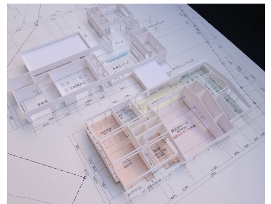
平面図や模型を基に、具体的な新しい施設のイメージをみんなで共有しました。