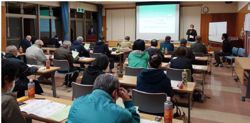
第6回市民ワークショップでは30名の市民により、基本計画素案に対しての意見やこれからの計画を進める中で大切にしなければならないことなどが議論されました。

計画策定作業は、5回目までの市民ワークショップでの議論を基に取りまとめた基本計画の考え方を、より具体的な形にまとめていく基本設計段階に取り掛かっています。第6回のワークショップでは、基本計画に対してパブリックコメントや住民説明会で出された意見、及び、基本計画策定後に、市より追加された条件（児童クラブを複合する）などを踏まえて、既存の保健福祉センターを改修する部分と、増築する部分とにどのような機能を配置したらいいのか、計画チームより3つの考え方が提示されました。それぞれの考え方を全体で議論した結果、既存部分に、総合支所、公民館諸室と商工会、シルバー人材センター、森林組合、などの民間施設を複合し、増築部に、児童クラブ、子育て広場、多目的ホール、図書館を複合させ、子ども、子育て関連の施設を充実させる考え方が、多くの支持を集めました。既存部と増築部は、公民館・図書館事務室でつなぎ、全体が一体的な施設として有機的につながります。この考え方をベースに、基本設計の精度を上げていく予定です。