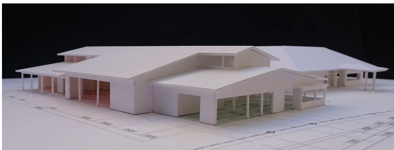
事務局より基本設計素案をベースとしたイメージ模型が提示されました。