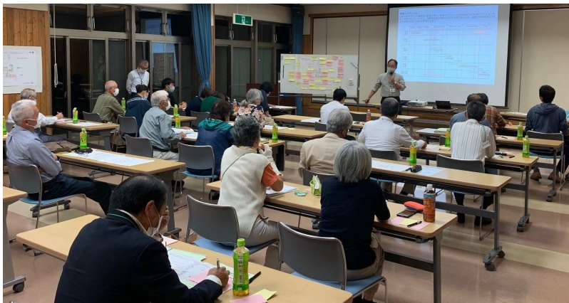
第5回市民ワークショップでは36名、後日行われた延長戦では33名の市民の方に参加して頂き、とても有意義な議論を行うことができました。

基本計画は、施設整備の基本理念や施設構成の大枠についての考え方を示すもので、施設の詳細については、引き続き、基本設計段階で検討を重ねていきます。