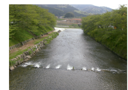
美祿大橋観測所付近 所在地 大瀬町東分362番地1