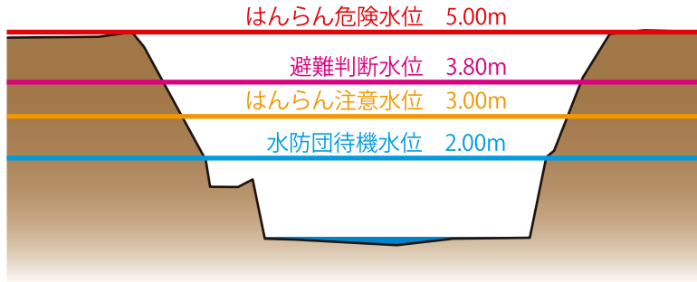
美祿大橋 河川断面図