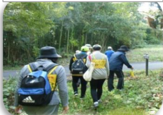
② 赤間関街道 中道筋