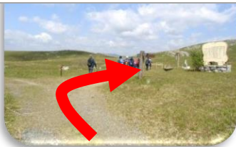
③冠山の看板を目印に右折