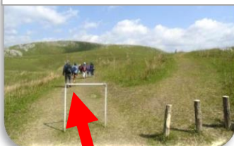
④三叉路の目印は車止め