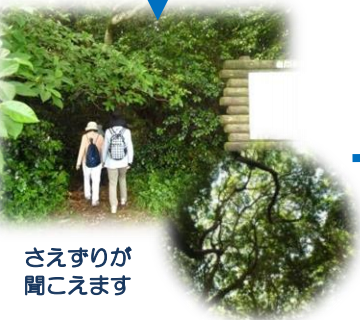
③冠山の看板を目印に右折