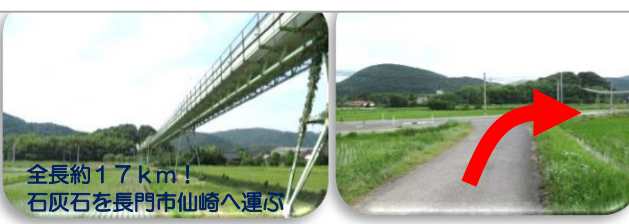
⑥ベルトコンベアをくぐってつきあたりを右折