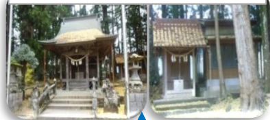
⑨巖島神社・諏訪神社

1871年に広島 の巖島神社から三柱 の水神を勧請祭祀 諏訪大明神の お告げで弁天 池を発見