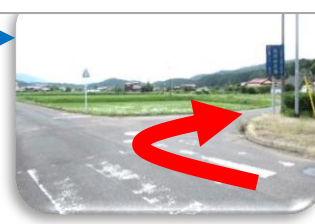
⑦弁天池の看板を右折