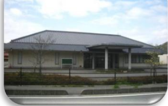
① 美東保健福祉センター