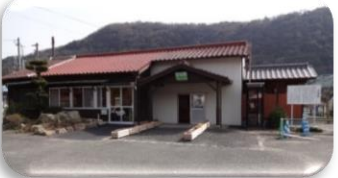
②於福地域交流ステーション