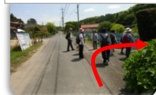
⑤カーブミラーを右折

寂定寺のヤマザクラ 本堂西側にあたる庭内の山麓にあり、目通り幹囲2.75m、高さ12mで枝を周囲に広げている。寛永の頃に植えられたと伝わる。