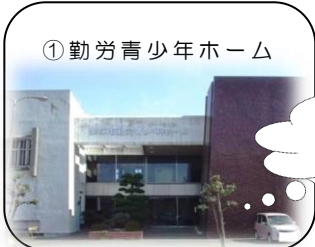
① 勤労青少年ホーム