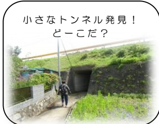
小さなトンネル発見! どーこだ?