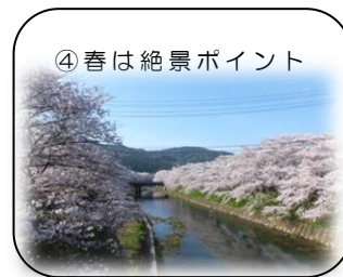
④ 春は絶景ポイント