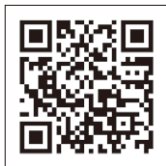
スリッパ卓球サイト