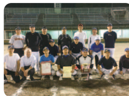
宇部マテリアルズシニア