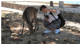
▲シカとハイチーズ