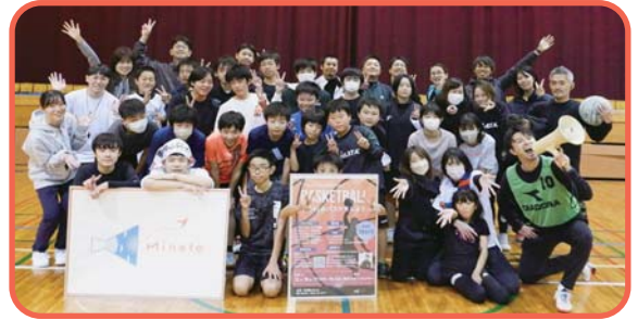
▲イベント本番は大盛況！

といった、塾生の“やりたい！”という想いが詰まった、周りの大人もワクワクするプロジェクトがたくさん生まれました。