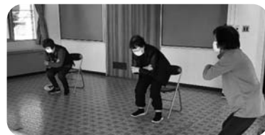
▲がんばって鍛えちよるよ！