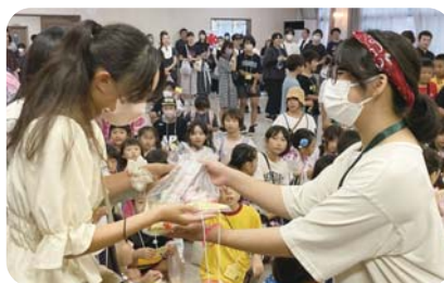
▲豪華景品に大満足！