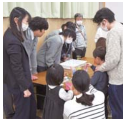
▲スライムの色は何色にしようかな?