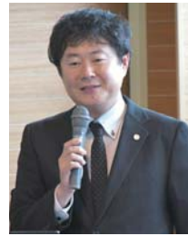
◀卒業後に必要となることは…