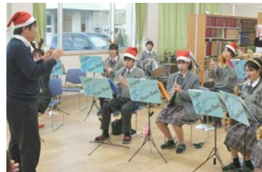
▲大盛況!クリスマスコンサート