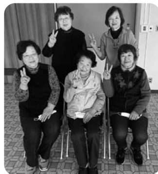
▲体操後にバシャリ！