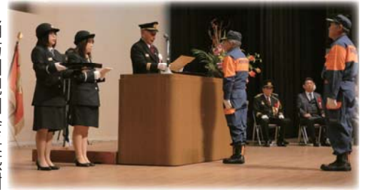
消防団親和会長感謝状

式典終了後は観閲行進、車両等の機械器具点検及び消防ポンプによる一斉放水が行われ、市民が消防団員の勇姿を観に来られていました。