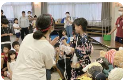
▲生徒会主催の福引き大会は大盛況！