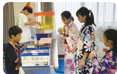
▲綿菓子ブースは大行列！

8月17日(日)伊佐公民館で、「第2回いさゆめちゃんまつり」を開催しました。このまつりは、昨年度、生徒会が学校運営協議会で「伊佐十七夜で出店して地域を盛り上げたい」と提案したことから始まりました。生徒会が運営するブースや福引大会、伊佐地区子ども会のブース、キッチンカーの出店などで、100名以上の参加者は大いにまつりを楽しみました。伊佐公民館をはじめ、多くの地域の皆さんの協力によって「いさゆめちゃんまつり」は支えられています。生徒会が企画・運営するこのイベントによって、地域が活性化し、ふるさと伊佐への愛着が育まれ、人づくり・地域づくりの好循環につながることを願っています。