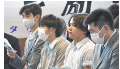
▲熱心に聴いています