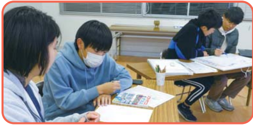
▲どんなプロジェクトにするか考え中

また、ただ“やりたい！”を叶えるだけでなく、自分も周りの大人もワクワクするようなプロジェクトを目指しています。そのために、新しくできるようになりたい「チャレンジポイント」、自分の大切にしている価値観「大事なこと」の要素も加えています。