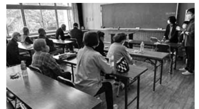
▲健康に関する講座の様子