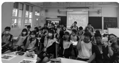
▲伊佐中学校と水里国民中学のオンライン交流の様子▲

トレッキングを専門に扱う那米哥(ラミゴ)国際旅行社が催行するツアーで、秋吉台・秋芳洞のほか、長門峡や錦帯橋などを観光されました。台北観光・交流事務所の働きかけがツアー造成のきっかけとなり、山口県と協力して実現しました。新型コロナウイルスの影響により催行を見送っておりましたが、この度ようやく実施され、ススキが広がる壮大な秋の秋吉台をトレッキングで楽しんでいただきました。