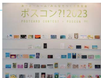
◀ 昨年のポストコン展示