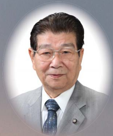
美祿市議会議長 竹岡 昌治