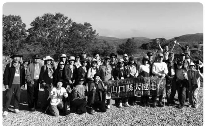
▲ラミゴツアーに参加された台湾からの旅行者のみなさん

台北観光・交流事務所では、引き続き、台湾及び東アジア諸国の皆さんに美祢市の魅力を伝えるとともに、沢山のお客様に訪れてもらえるよう努めてまいります。