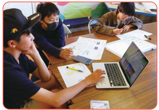
▲他の農家さんの商品ページをリサーチしている様子

一方で、「ごちそうさま投稿※」は0件という結果でした。（※ポケットマルシェでは、商品の購入者がその感想を農家さんのページに投稿する、「ごちそうさま投稿」という仕組みがあります。今回のプロジェクトでは、「ごちそうさま投稿を獲得すること」をミッションとしています。）