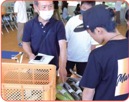
▲塾生から農家さんにインタビューを行い、野菜の特徴について紹介していただいている様子