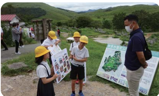
▲ふるさとの誇りを伝えたい

秋吉小学校の特色ある取組「ふるさとこどもガイド」、今年度は事前にガイドのプロであるトラベルパーサーの方からのご指導を受け、伝える技術を学びました。当日は天候と同様、子ども達の緊張が心配されましたが、みんな物怖じすることなく、積極的に観光客の皆さんへ声をかけ、説明をしていました。学校の名刺に沿ったQRコードで感想をたずねたところ、感激とお褒めの言葉がたくさん。子ども達には次へとつながる、良い経験を重ねることができました。