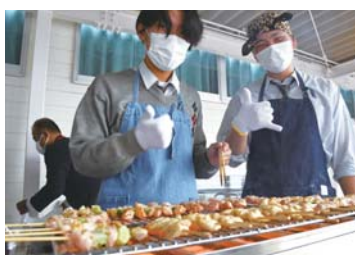
▲焼き鳥の前は大行列

3年ぶりの全校合唱「正解」で幕を開けた今年の成進祭、ステージで練習の成果を発表してくれた吹奏楽部や有志の皆さん、バザーの企画や準備、販売に力を尽くした皆さん、そして盛会をめざして早くから活動してくれた生徒会役員の皆さん、全校生徒247名一人ひとりが輝いた、笑顔あふれる成進祭となりました。