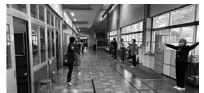
▲山口弁ラジオ体操の様子