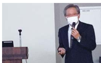
▲保護者からも高評価！