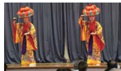
▲琉球舞踊 紅倫の会による舞踊披露