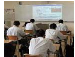
▲ 生徒からも見やすいと好評!

本館8教室の黒板をすべてホワイトボードに取り替えました。以前より大きく、電子黒板のプロジェクターで投影できる範囲もぐんと広がりました。ICT機器の充実により、今まで以上に生徒にとって分かりやすく魅力的な授業が提供できるよう私たち教員もがんばります。