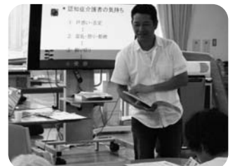
▲ 講話をしている様子