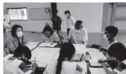
▲それぞれ熟議の様子

この熟議を契機に、於福小150周年を校区全員で祝う行事にするとともに、学校を核として、地域の絆を深めることができると期待しています。