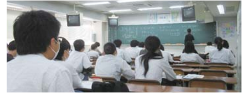
▲ 夏季講習を受講する様子

普通科特進コースの3年次が山口市の北九州予備校で開催された自習体験会に参加しました。静かな環境の中で他校の受験生と一緒に自習に取り組み、2日目は夏季講習も受講させていただきました。緊張感を肌で感じる事が非常に良い刺激となり、受験生としての意識をより高めることができました。