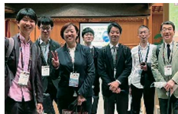
▲シンポジウム関係者

最後に、普段の診療や学会発表に際し、ご協力頂いた全ての方に、この場をお借りして、御礼申し上げます。今後とも何卒宜しくお願い致します。