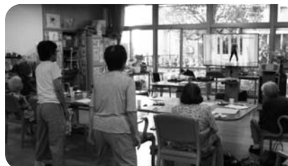
▲ 体操をしている様子

「えむカフェ」はコロナの影響でしばらく休止していましたが、令和5年6月より再開しましたのでよろしくお願いたします。「えむカフェ」のスタッフは、美祿市立病院とグリーンヒル美祿の専門職なので、認知症に関連する講話を中心に、認知症予防の体操や作業活動などを実施しています。現在の参加者は、認知症に関心が高い方が多く、専門職のスタッフと気軽に交流することができています。どなたでも参加できますので、お気軽にお越しください。