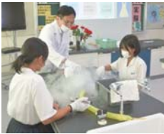
▲ 理科実験 不思議?がいっぱい