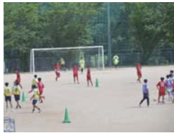
▲ サッカー講座 暑くても大盛況!