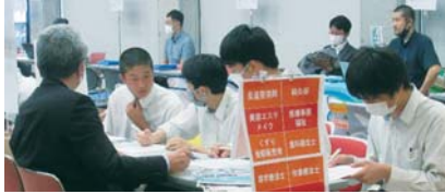
▲ 進学相談会の様子