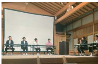
▲シンポジウムの様子

日本は高齢化が進み、それに伴い病気の割合が変化しています。厚生労働省の将来予測によると、今後は肺炎や心疾患、脳血管疾患などが増え、「大学病院などの高度急性期病院に入院するほどではない」病気が増えるとされています。先進医療や大手術で“治す”医療から、高血圧や糖尿病、がん、認知症など複数の病気を抱えながら、自宅や施設で暮らし続けられるよう“支える”医療のニーズが高まっています。