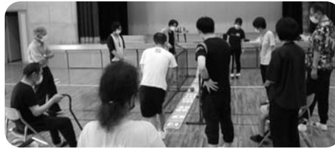
▲レールゲームの様子