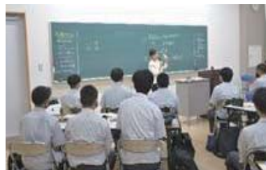
▲第一印象のポイントは？

7月21日(金)に、厚生労働省の委託事業として、就職希望の3年生を対象に9月からの就職試験に向けたガイダンスを行いました。午前は表情や身だしなみなどの第一印象とあいさつや気遣いの大切さ、求人票の見方等について、経験豊富な講師から優しく丁寧な指導が行われました。午後はまず、自己紹介・志望動機の文書作成時のポイントについて学びました。その後、模擬面接で全員が受験者と面接官の役割を経験し、なかなかうまくできず悩んでいる姿も見られましたが、実践的な対応力を養うよい機会になりました。最後に講師から就職試験へ向けてアドバイスと励ましの言葉をいただきました。この機会を活かし、多くの生徒が希望企業から内定をいただけることと期待しています。