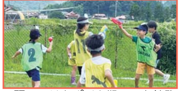
▲頭につけたポイを狙って水鉄砲を撃つ様子

塾生が考案したのは、絶景宝探しin秋吉台とウォーターサバゲー in 弁天池の2つのイベント。どちらも、小学生を中心にたくさんの家族連れにご参加いただきました。2つのイベントで合わせてなんと、約100名の方にお越しいただきました。