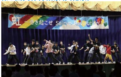
▲昨年の美祿青嶺祭の様子

9月30日(日)に、第9回美祿青嶺祭を「Time to Shine～個々(ここ)だけの青春を～」のテーマのもと開催します。なお、今年度は4年ぶりに一般公開とし、恒例のダンスコンテスト「Mine☆Con」や有志によるステージ発表等を行う予定です。詳細については学校ホームページ等でご確認ください。