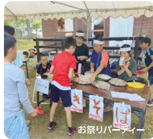
お祭りパーティー