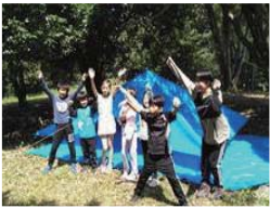
野営準備 集合写真