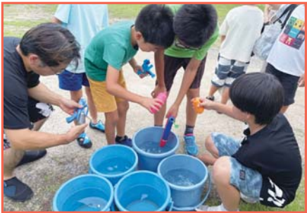
▲ゲームに使う水鉄砲に弁天池の水を汲んでいる様子

参加者の方からは、「中学生主体となってゲームを企画してくれたことで、子供目線でもあり良かった」、「ありそうでないイベントで面白かった」、「たくさん綺麗な景色が見られたのがとてもよかった」などといった感想をいただきました!