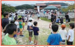
▲ルール説明を聞く様子

挑戦のトビラのひとつとして、5月から約3ヶ月かけて進めてきた「イベントプロジェクト」。7月15日(日)に、塾生が考案したイベントを無事開催することができました!