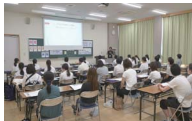
▲1回目の様子 ビジネス科体験 大人気!

☆1回目は約620名が来校! 1回目と内容が異なるため、前回参加していただいた方もぜひご参加を!!