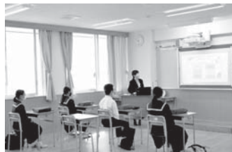
<入試対策講座 国語>