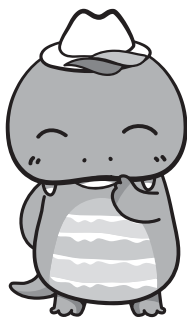
美祢市公式キャラクター ミネドン

一般事務(A)については、 年時から申込み期限までの間は大変混み合うことが予想されます。 申込みはお早めにお願 いします。