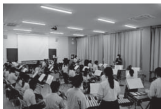
<吹奏楽講座 会場満席！>