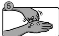
親指と手のひらをねじり洗います。