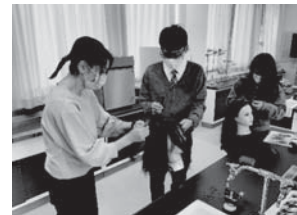
<美容師関係、先生も参加！>