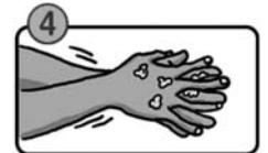
指の間を洗います。