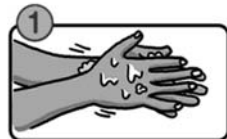
流水でよく手をぬらした後、石けんをつけ、手のひらをよくこすります。

手にはたくさんのウイルスが付着しています。外から帰った後、食事の前、調理の前後など、こまめに手を洗きましょう。指先・指の間・手首もしっかり洗いましょう。