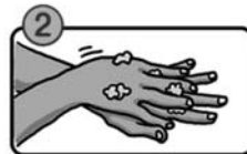
手の甲をのぼすようにこすります。