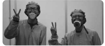
同じ高校出身で息もぴったり!とても明るい二人