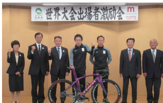
写真は、10月18日(日)に行われた世界大会出場激励会