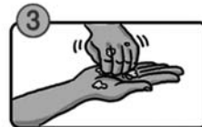
指先・爪の間を念入りにこすります。