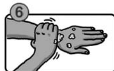
手首も忘れずに洗います。