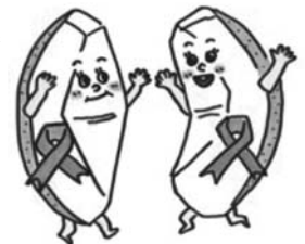
美祢市健康増進キャラクター