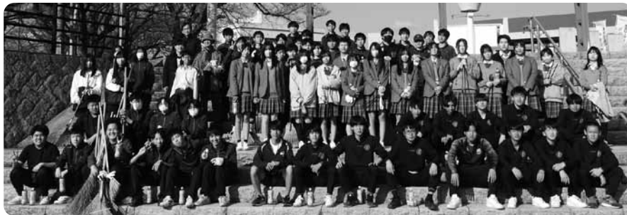
▲清掃活動を終え、清々しい気持ちで集合

3月12日回、本校の生徒および教職員による厚狭川沿いの清掃活動を行いました。今回は部活動に所属する生徒を中心に、昨年度を大幅に上回る約65名の生徒と教職員7名、総勢72名が参加しました。厚狭川の桜並木道から河川敷まで、一つひとつ丁寧にゴミを拾い上げ、地域の環境