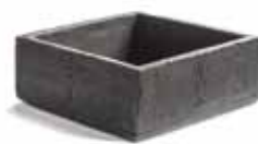
▲山神枡(さんじんます)

「山神枡」は、室町時代にあたる天文9年(1540年)に製作された木製黒漆塗の一升枡で、当時の祭礼で用いられたものと考えられます。中国地方の村落に残された希有な例であり、量制史上、社会経済史上、学術価値が高いものです。