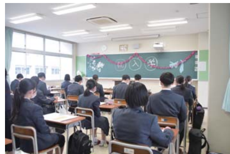
▲初めてのホームルーム