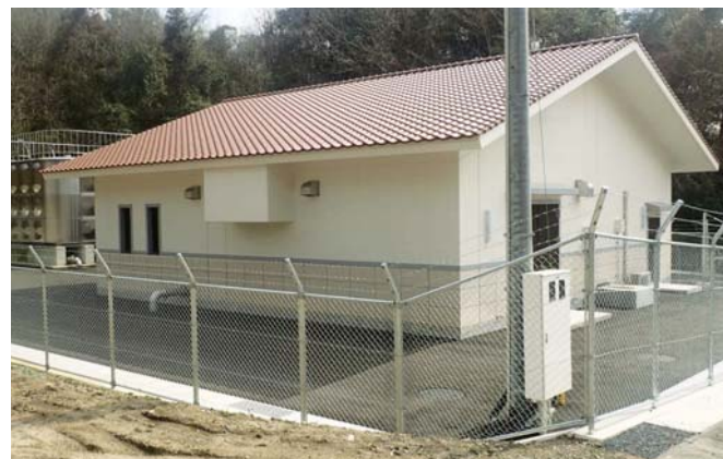
▲完成した曾原中継ポンプ所