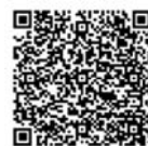
年度更新申告書▲ 書き方パンフレット