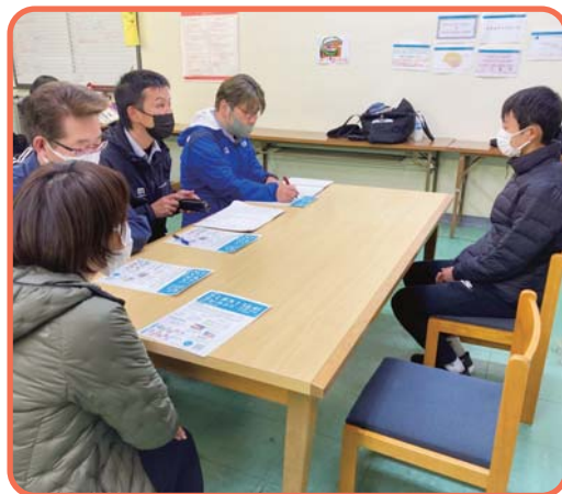
▲地域の方に協力を依頼