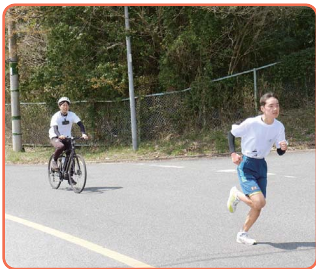
▲トライアスロン挑戦中!